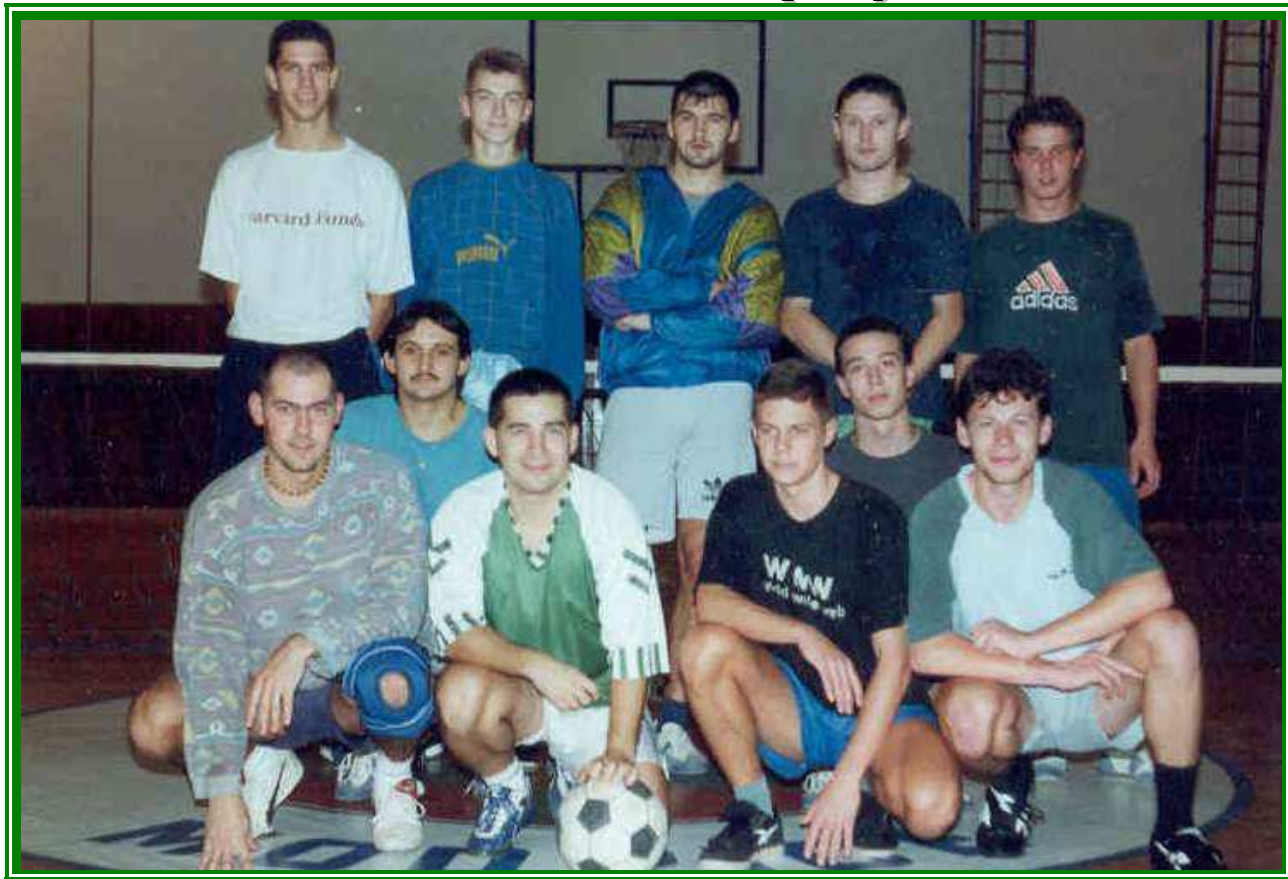
Zimní příprava obou družstev, „A“ i „B“:

A uvedl se ihned skvěle a stal se platným hráčem!