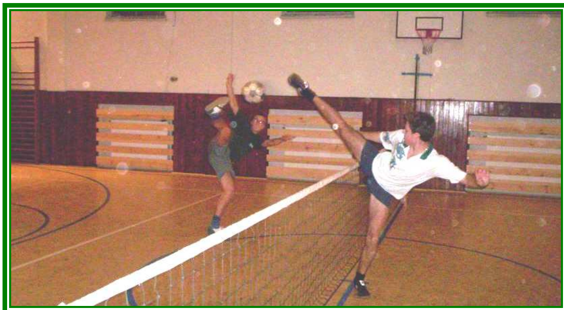
Hráči „B“ družstva při zimní přípravě: